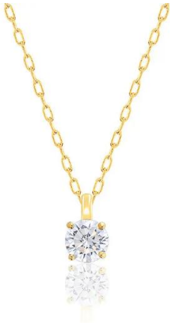
DEMETRA Collier Diamant Solitaire HSI Or Jaune 750, Longueur 42 cm