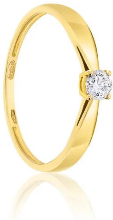
DEMETRA Bague Solitaire Diamant